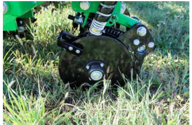
Disco apri solco / Fertilizer opener disc