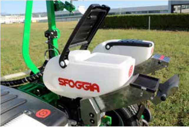
Tramoggia / Hopper