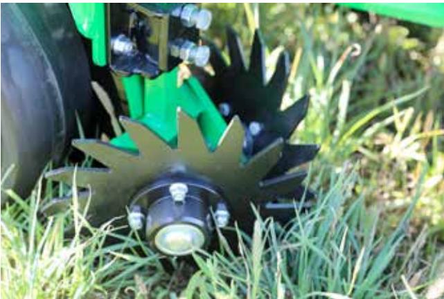
Disco a stella rotativo / Residues stars