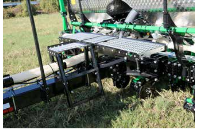
Pedana di carico / Loading platform