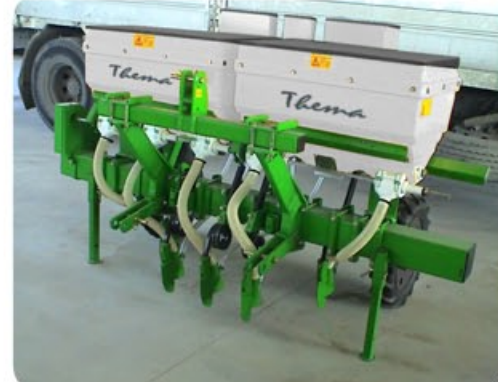
Versione con spandiconcime 250L e microgranulatore, ruote tractor e assolcatori concime. Version with fertilizer 250L and pesticide, tractor wheels and fertilizer shoe. Version con fertilizador 250L y microgranulador, ruedas tractor y botas. Version avec fertiliseur 250L et microgranulateur, roues tractor et socs fertiliseur.