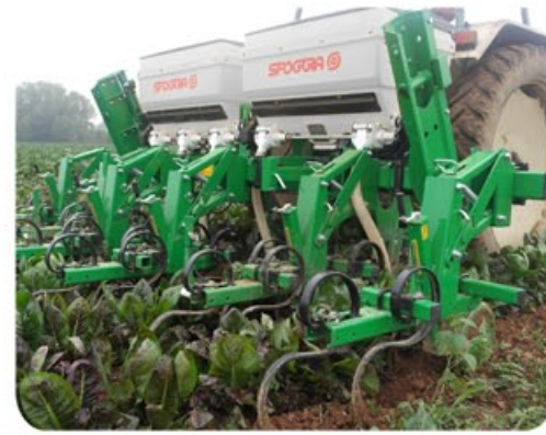
Configurazione per sarchiatura ortaggi Configuration for vegetable cultivation Configuración para el cultivo de las hortalizas Configuration pour la binage de légumes